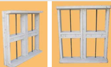
0.80 x 0.80 - vidrio Fijo + reja