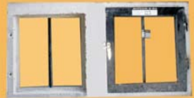
0.40 x 0.80 - 1 hoja de abrir de chapa + reja