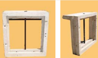
0.40 x 0.40 - vidrio Fijo + reja