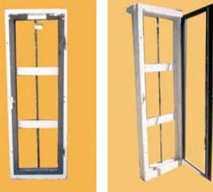
0.40 x 1.12 - hoja de abrir de chapa + reja