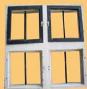
0.80 x 0.80 - 2 hojas de abrir de chapa +