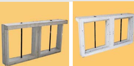
0.40 x 0.80 - vidrio Fijo + reja